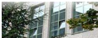
2000 Giochi a squadre Soluzioni

Ricerca > Centri di Ricerca > PRISTEM > Giochi matematici > Archivio edizioni precedenti - testi di allenamento > 2000 Giochi a squadre