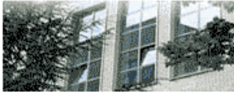
2000 Giochi a squadre Soluzioni

Ricerca > Centri di Ricerca > PRISTEM > Giochi matematici > Archivio edizioni precedenti - testi di allenamento > 2000 Giochi a squadre