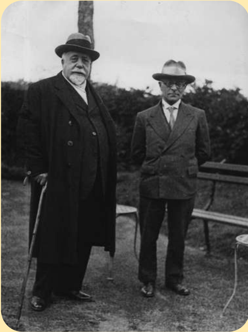
Vito Volterra e Tullio Levi-Civita