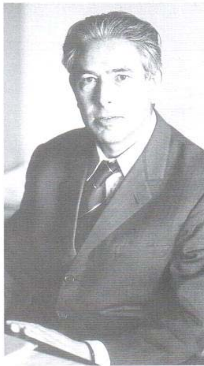
Ennio De Giorgi, negli anni Settanta

In questo modo vengono escluse alcune funzioni BV la cui derivata nel senso delle distribuzioni non ha carattere né n -dimensionale né (n-1) -dimensionale. Nel caso n=1 della retta reale, un esempio classico di funzione di questo tipo è la funzione di Cantor-Vitali, la cui derivata nel senso delle distribuzioni è una misura diffusa (cioè non 0-dimensionale) ma singolare rispetto alla misura di Lebesgue, in quanto concentrata sull'insieme di Cantor, che ha misura nulla. Visto il tipo di energia che si minimizza nei problemi con discontinuità libere, la restrizione proposta da De Giorgi risulta naturale. Come è spesso accaduto con le teorie proposte da De Giorgi (un altro buon esempio è la \Gamma -convergenza) la teoria dei problemi con discontinuità libere ha rivelato un ambito di applicazioni più generale di quello inizialmente previsto. In questi ultimi anni sono stati studiati modelli del secondo ordine (con discontinuità della funzione e/o del suo gradiente) e problemi suggeriti dalla meccanica dei continui, di plasticità, danneggiamento e frattura.